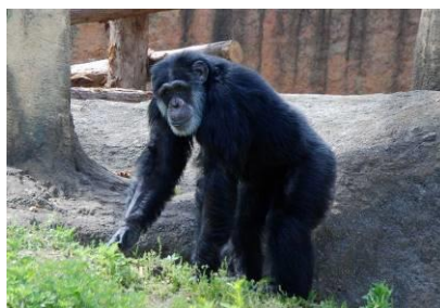
チンパンジー「イチロー」