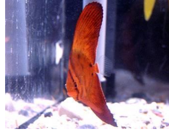
ナンヨウツバメウオ