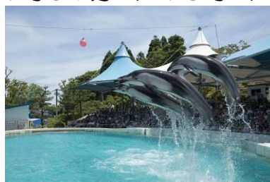
イルカ・アシカショー