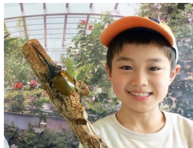
ヘラクレスとツーショット