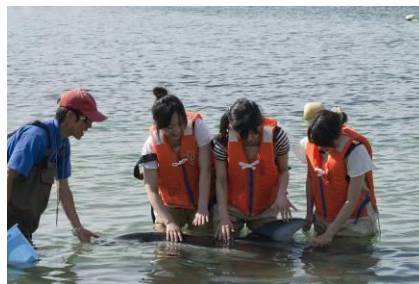
イルカとのふれあいビーチ

( https://www.notoaqua.jp/beach/ )をご確認ください。